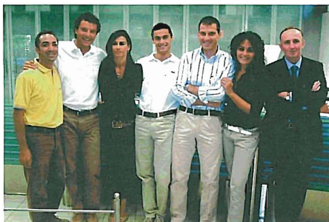
Dall'alto: lo staff di Cattolica Centro e Cattolica Mare