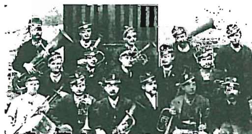
La Banda nel 1893

- La banda di Gradara ha festeggiato 120 anni di belle storie con una cerimonia lo scorso 29 luglio. Insieme al borgo, al mito di Paolo e Francesca, alla BCC di Gradara, è una delle istituzioni della cittadina. I destini e gli uomini della Banca e della Banda da sempre si intrecciano